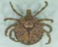
キラマダニの一種