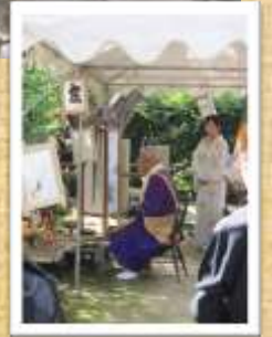
(ペンネーム ひこべえ)